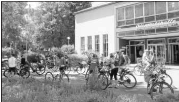
Teilnehmerinnen und Teilnehmer der Informationsveranstaltung zum Radverkehrskonzept sammeln sich vor der Odenwaldhalle in Michelstadt zum Start der abschließenden Radtour.

Hierzu stellt das Planungsbüro mit einer so genannten RQ9-Markierung einen möglichen Lösungsansatz vor: Außerhalb geschlossener Ortschaften werden hierbei beidseitig gestrichelte Linien auf der Straße angebracht, die den Fahrbahnquerschnitt optisch verringern. Diese Linien werden in der Praxis nur dann überfahren, wenn der Platz zum Passieren anderer Verkehrsteilnehmenden benötigt wird. Kombiniert mit einer Geschwindigkeitsbeschränkung, sorgt die Markierung für mehr Sicherheit beim Miteinander von Fahrrädern und Kraftfahrzeugen.