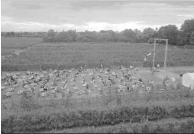
Die Künstler des „Unterwegs Varieté“, das am 10. Juli in der Oberzent zu Gast ist, in Aktion.

Die Veranstaltungsreihe „Kunst geht auf Reisen – und wir gehen mit!“ setzt sich im Juli mit dem im November 2019 gegründeten Novembertheater fort. Sämtliche Akteure wirkten während des langjährigen Bestehens der Theater-AG an der Ernst-Göbel-Schule (TEGS) bei verschiedenen Produktionen mit. Nach seiner Premiere an dieser Schule und der Aufführung auf der Naturbühne in Breuberg-Rai-Breitenbach im Juni „reist“ das Novembertheater nun nach Michelstadt. Das Ensemble schlittert mit dem Stück „WIRRUNGEN; Wirrungen, Wirtshaus“ auf den Spuren von Benatzky, Burroughs und Jacoby und verstrickt sich mit Spiel und Gesang in die Erinnerung an das goldene Zeitalter des Volkstheaters. Karten sind noch für die Aufführungen am 9. Juli und 10. Juli 2021 für jeweils 20 Uhr erhältlich. Weitere Informationen sind unter www.novembertheater.de zu finden.