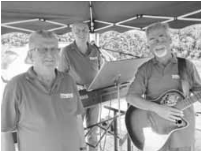
Die Kapelle Rumbel di Bumbel sorgte auch in diesem Jahr für gute Stimmung auf dem CDU-Grillfest