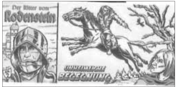
Titelseiten der beiden Comic-Hefte: „Das Turnier“ und „Unheimliche Begegnung“

Die Ausstellung wird bereichert durch schmackhaft-zauberhafte alkoholische und nichtalkoholische Getränke wie „Rodensteiner Ritterblut“ und „Wildweibchen-Liebestrank“.