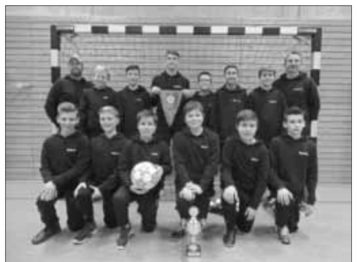
Die JSG Rodenstein wird Hallenkreismeister 2019