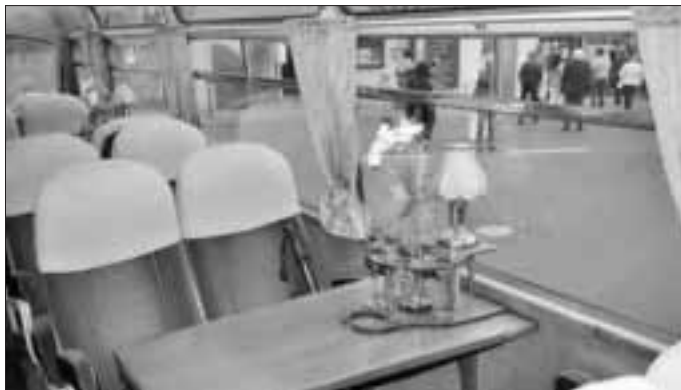
Der Nostalgiebus ist angekommen.