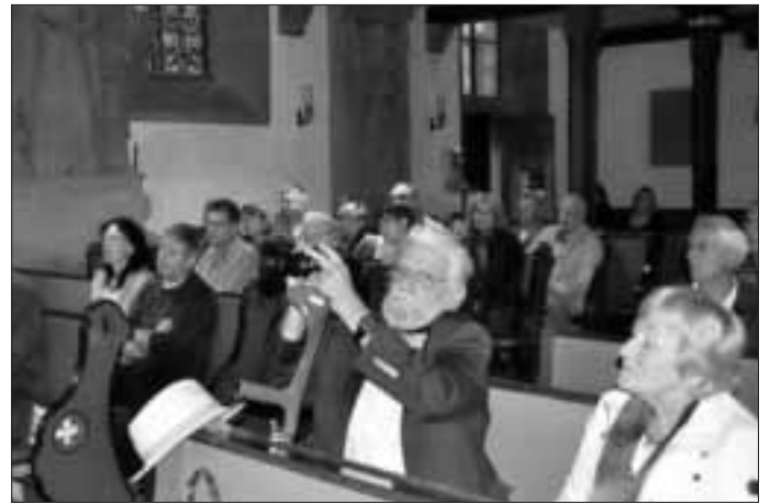
Blick auf die Kirchenbesucher