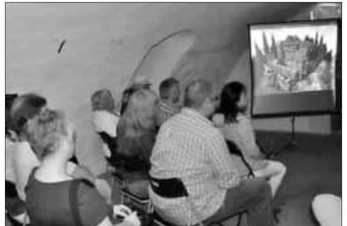
Im Kellergewölbe des Museums erleben die Gäste das 3-D-Modell der Burg Rodenstein.