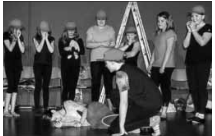
Der Apfel ist ihr nicht bekommen: Schneewittchen als moderne Liebesgeschichte mit dem Prinz auf einem Skateboard, inszeniert von den der Theatergruppe „Skyflyer“ (Leitung Uli Zelta-Rosche) der GAZ, den Jüngsten in der Fachschaft.

It's showtime, hieß es wieder einmal an der Georg-August-Zinn Schule in Reichelsheim. Theater AG und Theaterkurse zeigten, woran sie das Jahr über gearbeitet hatten. Diese Aufführung findet alljährlich an den Theaterabenden der Schule statt und gewährt den Zuschauern einen aufschlussreichen Blick darauf, wie die Schüler lernen, Theater zu machen – im wörtlichen Sinne!