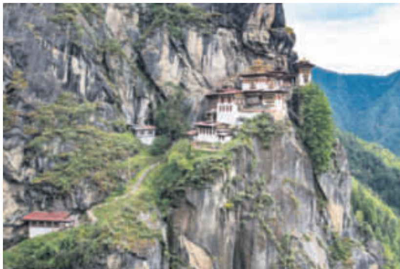
Erlebnis der besonderen Art: die faszinierenden Klosterburgen Buthans

Der Eintritt für die Audiovisions-Show ist frei. Der Veranstalter von „Crumbach hilft!“, der Wirtschafts- und Verkehrsverein Fränkisch-