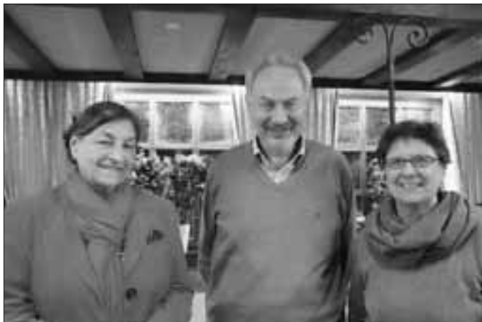
„Drei neue Vorstandsmitglieder“